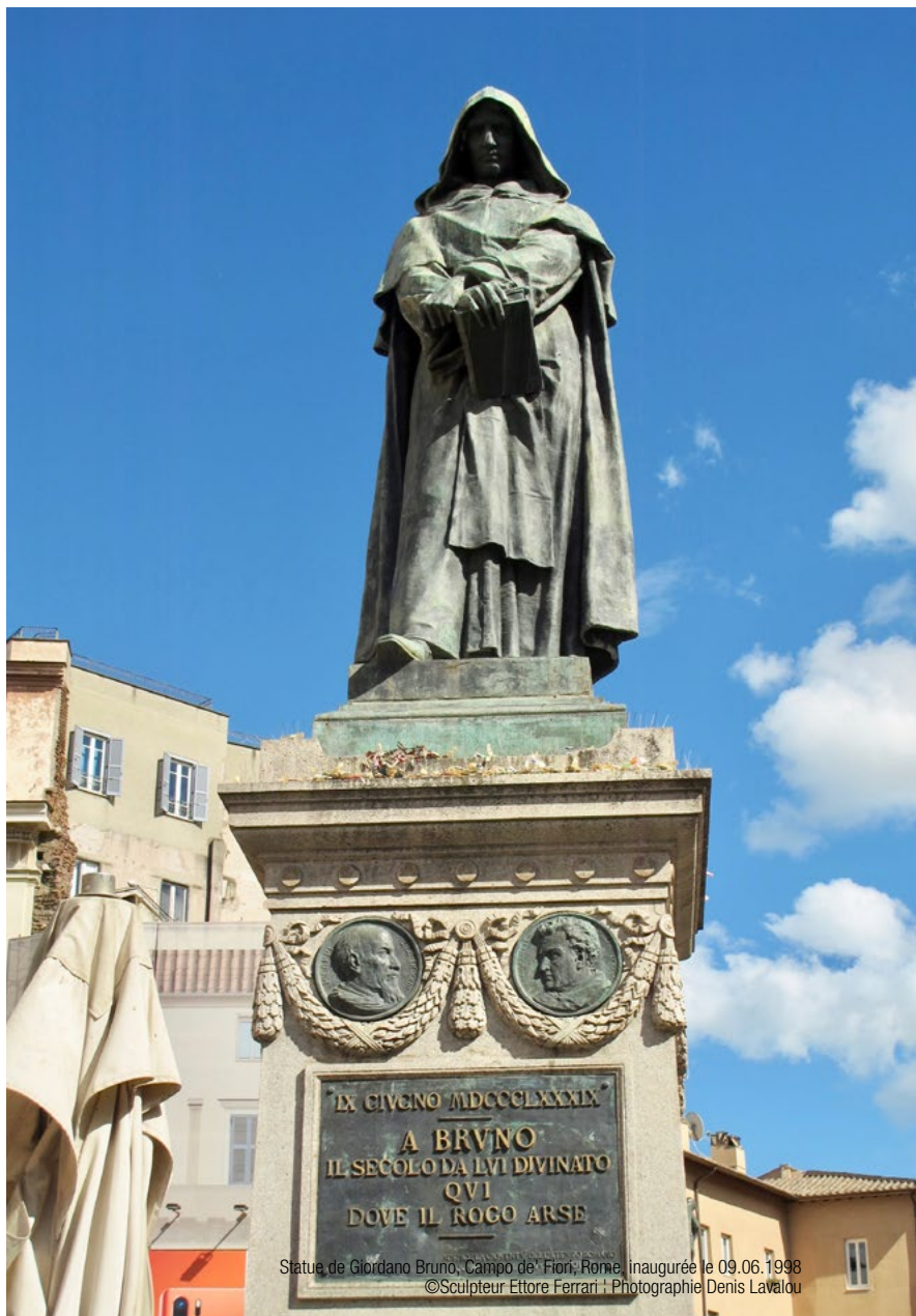
Statue de Giordano Bruno, Campo de' Fiori, Rome, inaugurée le 09.06.1998 ©Sculpteur Ettore Ferrari

Infos: www.lescelebrants.ch ; www.theatrecomplice.com ; www.unijambiste.com ; www.iicmontreal.esteri.it